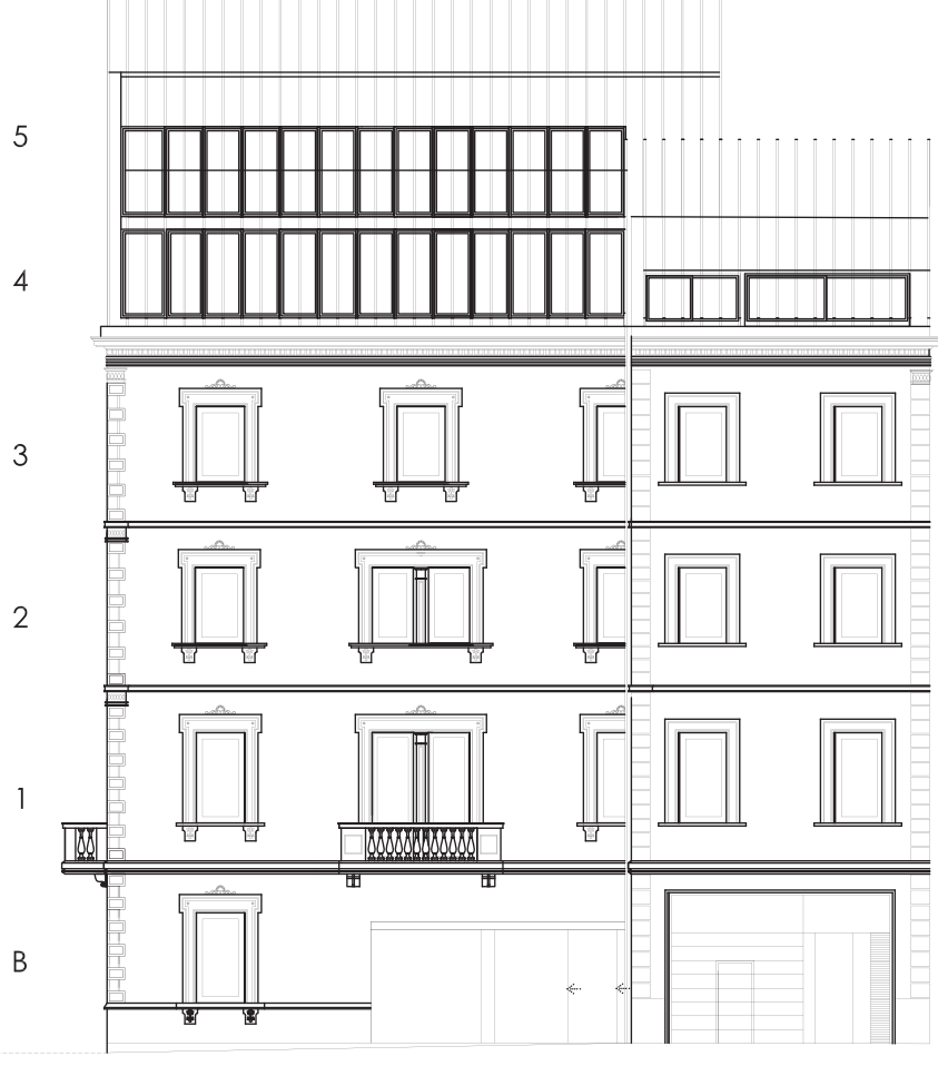
FACHADA TORRENT DE L'OLLA / facade torrent de l'olla