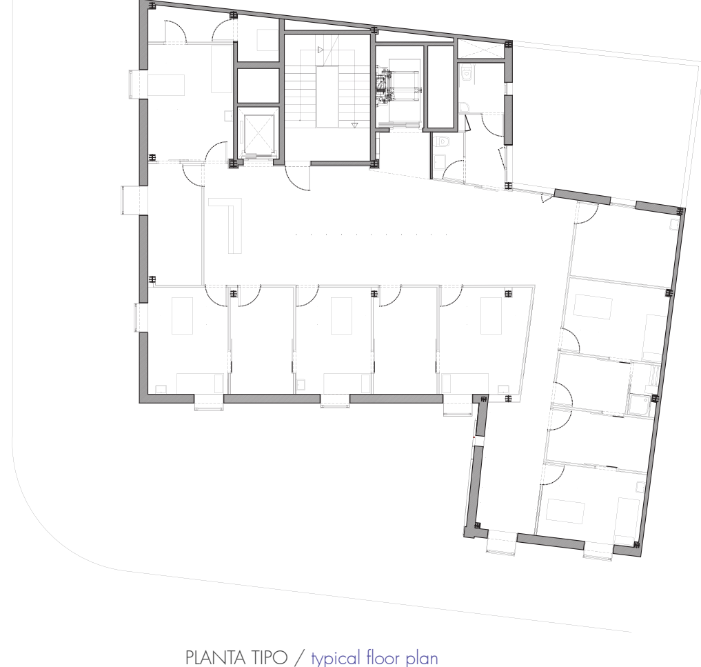
PLANTA TIPO / typical floor plan