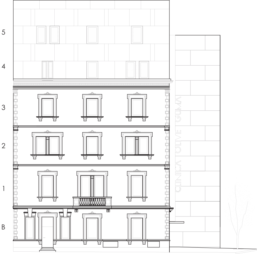
FACHADA CÒRSEGA / facade còrsega